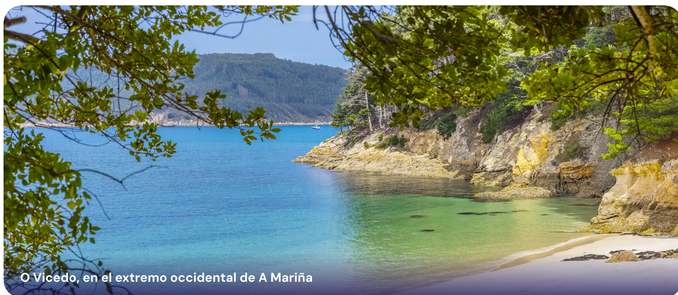
O Vicedo, en el extremo occidental de A Mariña

El único de España, sobre la playa de San Román.