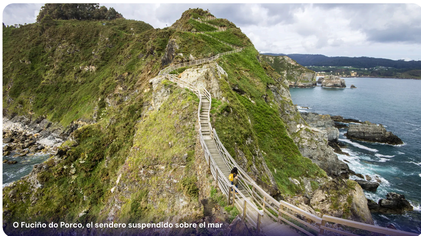
O Fuciño do Porco, el sendero suspendido sobre el mar

La desembocadura del Sor, frontera con A Coruña, se cruza por el punte metálico verde de 1901 , peatonal y muy fotogénico.